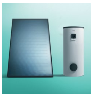
Kolektor + spremnik