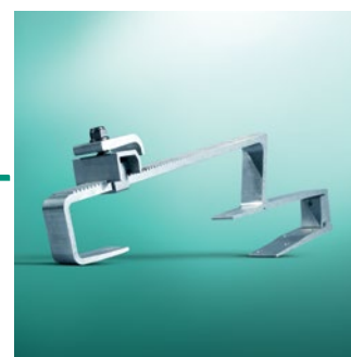
Krovni nosač Tip P (standardni crijep)