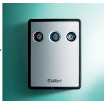
Solarna cijevna grupa