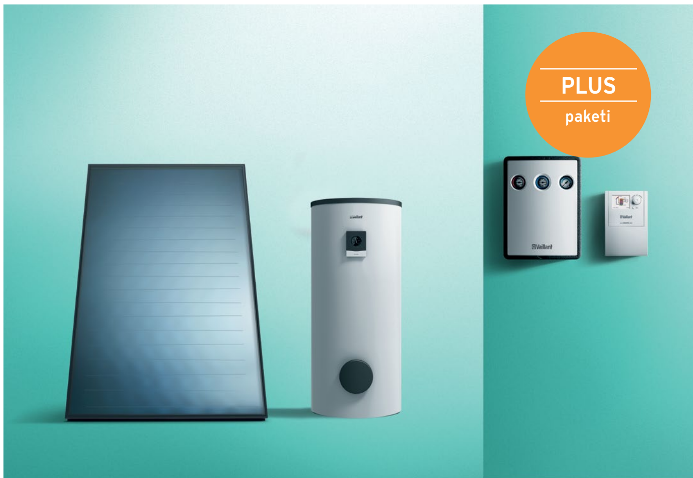
Prikaz solarnog paketa VIH PLUS sa spremnikom

Solarni akcijski paketi PLUS VIH 300 i PLUS VIH 500 kompletni su paketi za solarnu pripremu potrošne tople vode putem kojih je moguće uštedjeti godišnje i do 60% potrebne energije u zagrijavanju tople vode. Brzom povratu investicije svakako će pridonijeti pouzdana i dugotrajna tehnologija.