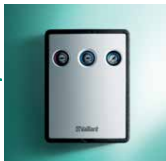
Solarna cijevna grupa