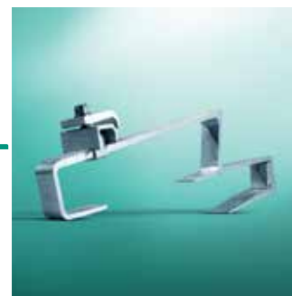
Krovni nosač Tip P (standardni crijep)