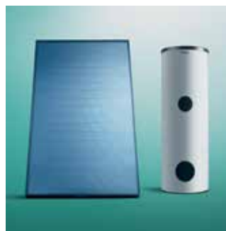
Kolektor + spremnik