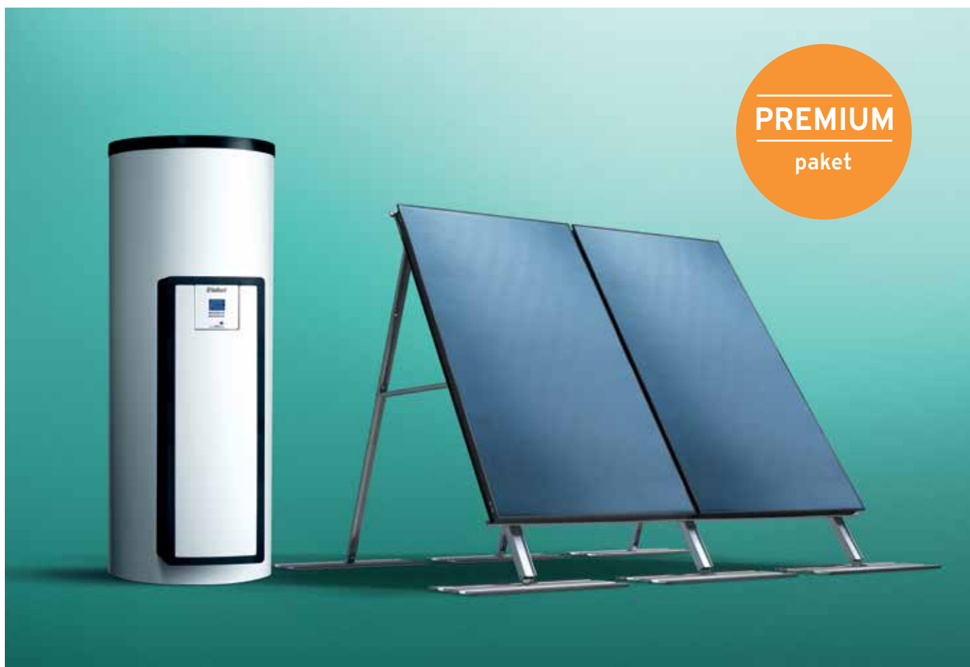
Solarni spremnik s „drain-back“ modulom te kolektorom