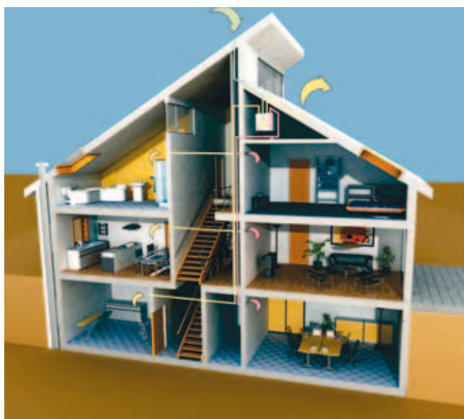
Ventilacijski sustav recoVAIR na primjeru

■ dovod zraka ■ odvod zraka ■ svjež zrak