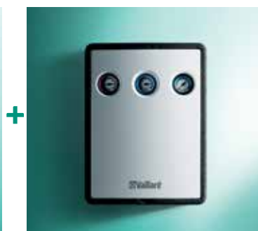
Solarna cijevna grupa