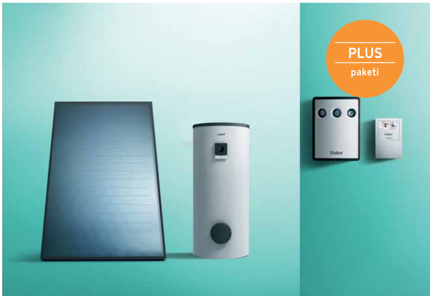
Prikaz solarnog paketa VIH PLUS sa spremnikom

Solarni akcijski paketi PLUS VIH 300 i PLUS VIH 500 kompletni su paketi za solarnu pripremu potrošne tople vode putem kojih je moguće uštedjeti godišnje i do 60% potrebne energije u zagrijavanju tople vode. Brzom povratu investicije svakako će pridonijeti pouzdana i dugotrajna tehnologija.