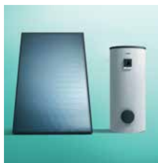
Kolektor + spremnik